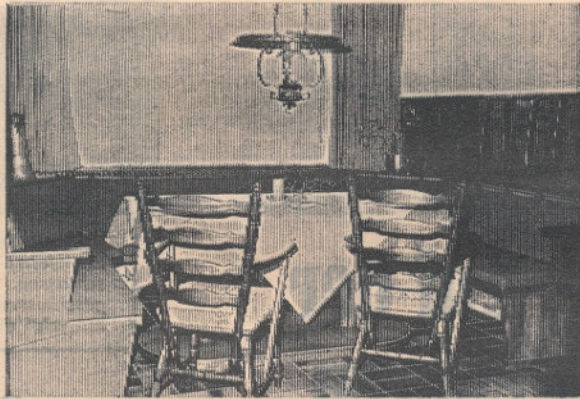
Wäre dieser Winkel nichts für einen zünftigen Skat oder Doppelkopf?