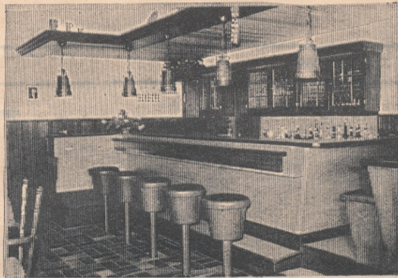
Das ist die neue Gaststube