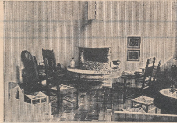
Hier fühlt man sich gemütlich am offenen Kamin

Unser Mitarbeiter nahm Gelegenheit, sich mit dem früheren Bürgermeister der Gemeinde Holtum-Marsch, zu dessen Amtsbereich auch die Verwaltung Jerusalems gehörte, zu unterhalten,