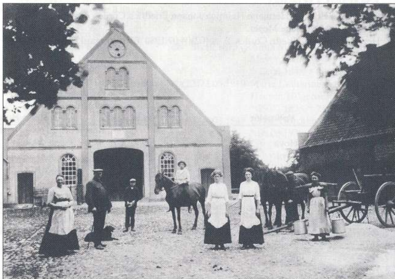
Oiste Nr. 32, Kothenmeyer. Familie und Gesinde posieren etwa 1910 für den Fotografen.