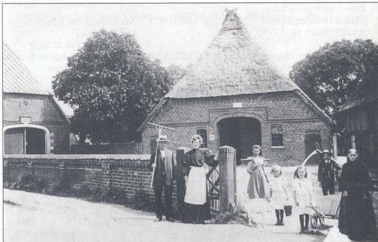
Oiste Nr. 29, Hofstelle Kuhlmann/Clausen; Foto um 1910.