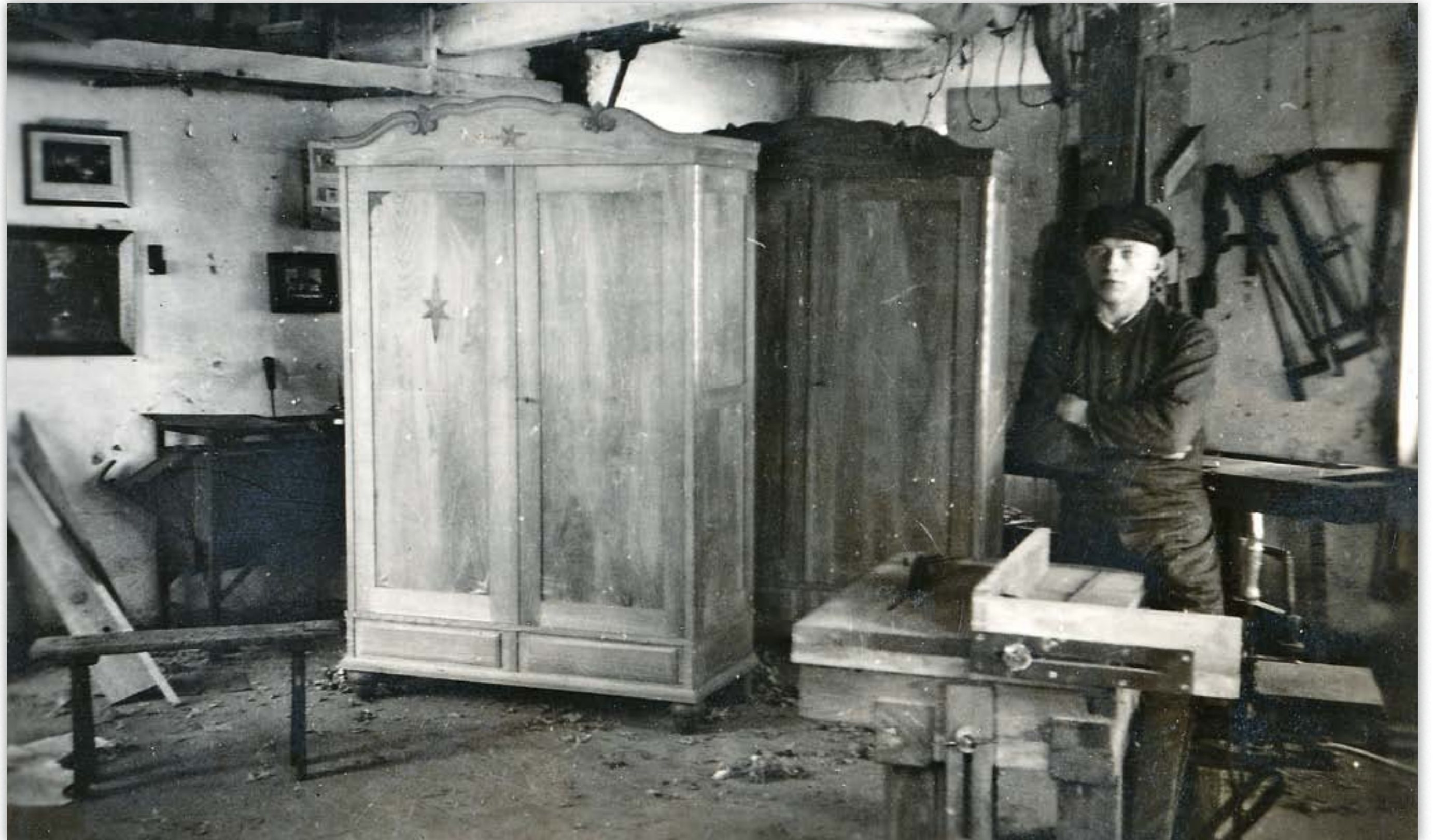
Tischlerei Freese, Heidweg 5, Holtum-Marsch 1930.