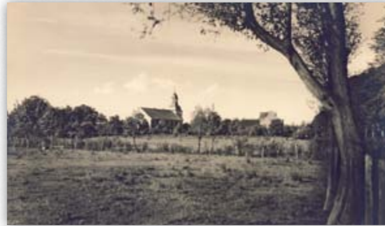
Titelbild: Postkarte mit Ansicht Kirche und Pfarrhaus in Blender um 1930