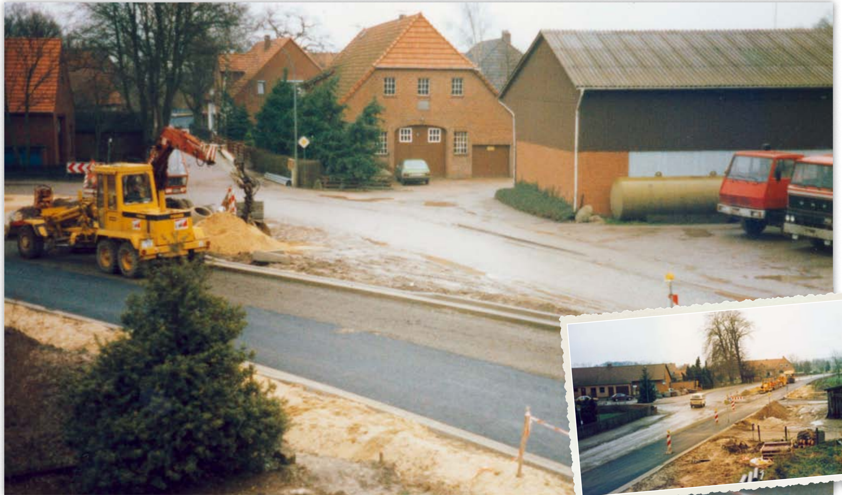
Ausbau der Blender Hauptstraße 1988.