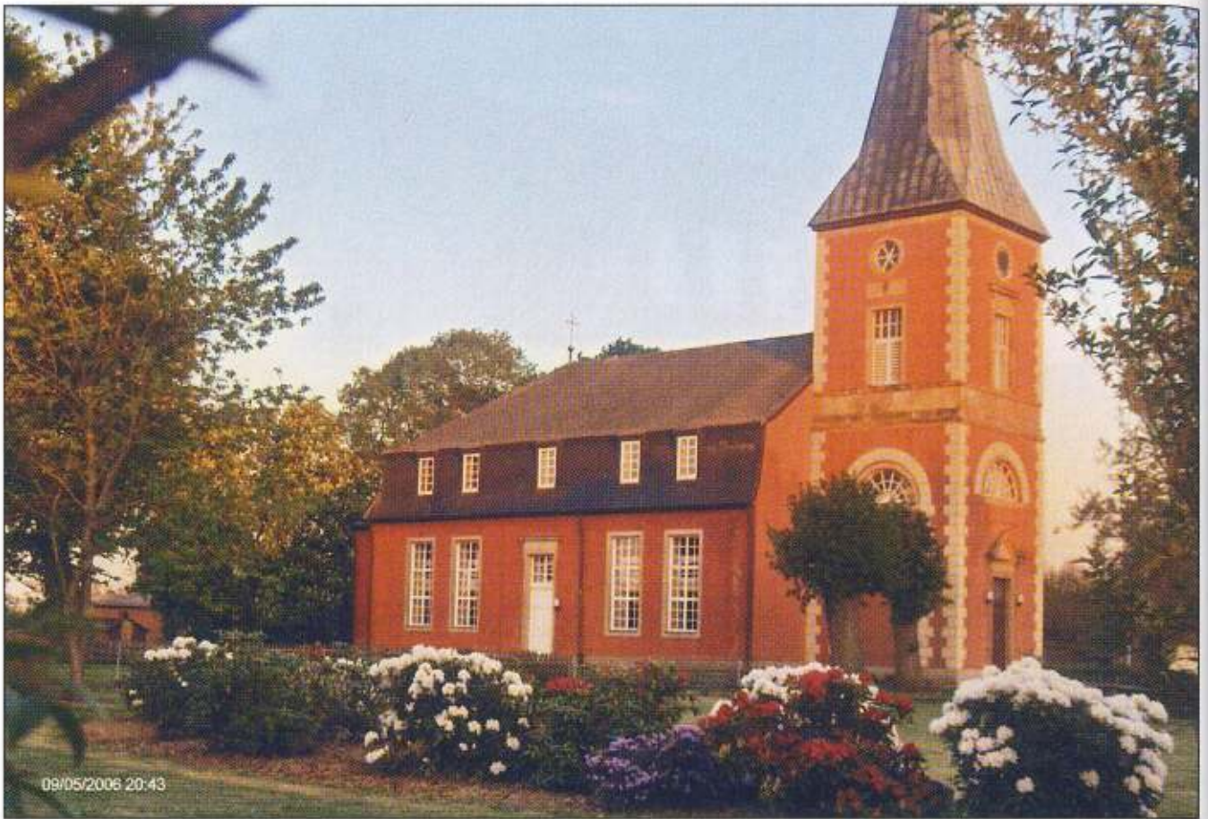
Die schmucke St. Michaeliskirche Intschede