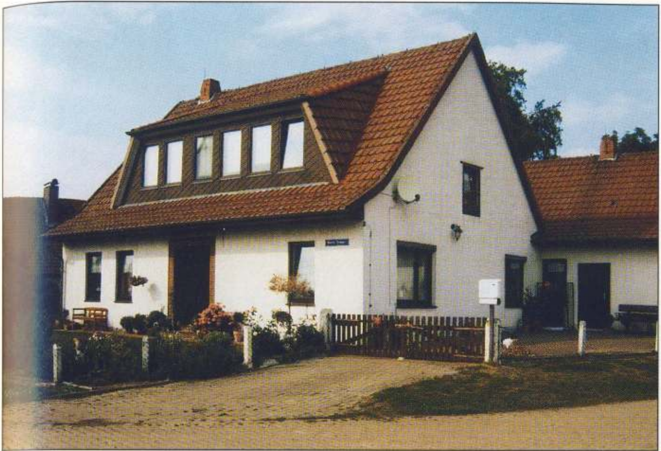
Intschede Nr. 109, Reerer Damm Nr. 7