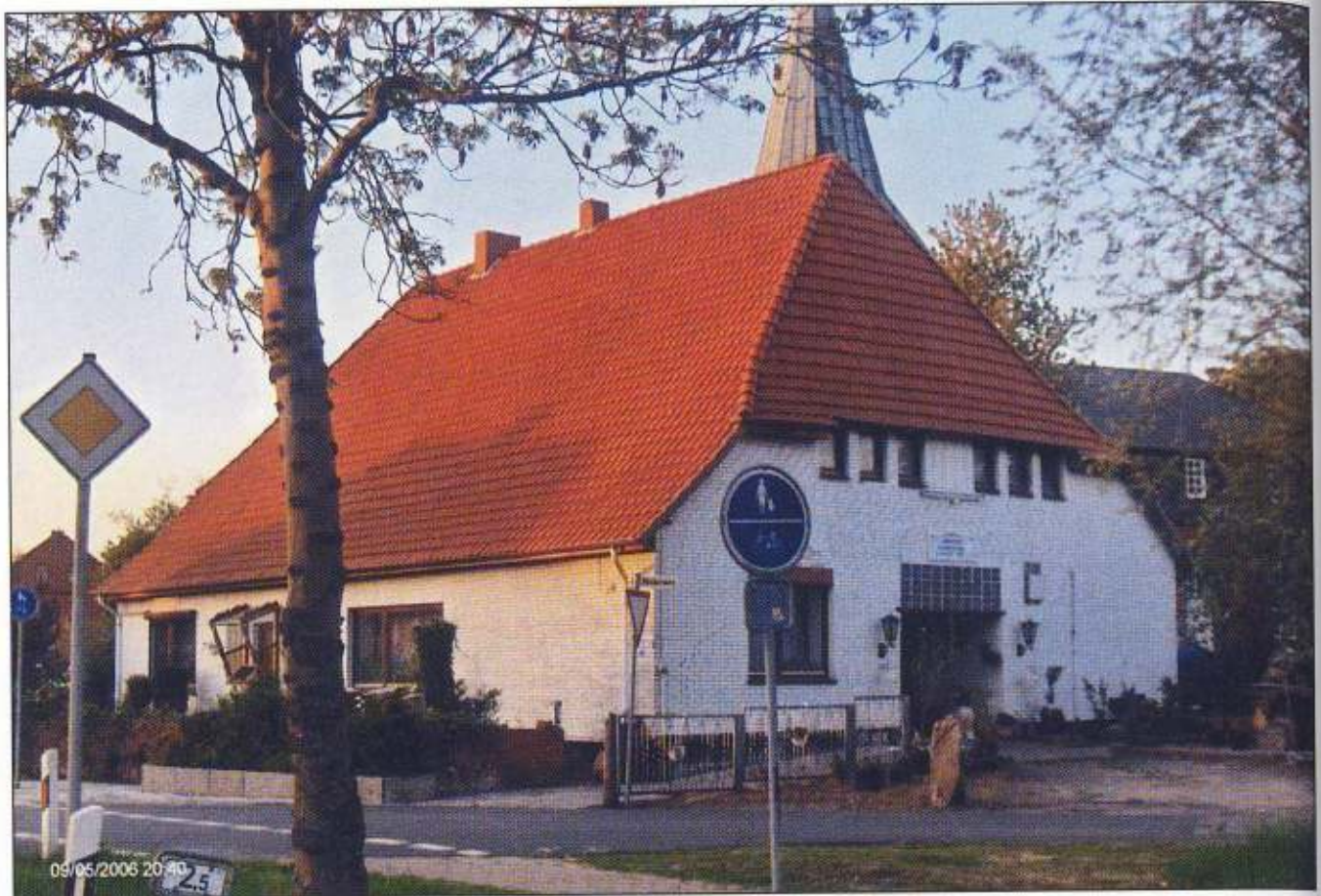
Das frühere Pfarrwitwenhaus. Nr. 112, Heckenweg 1