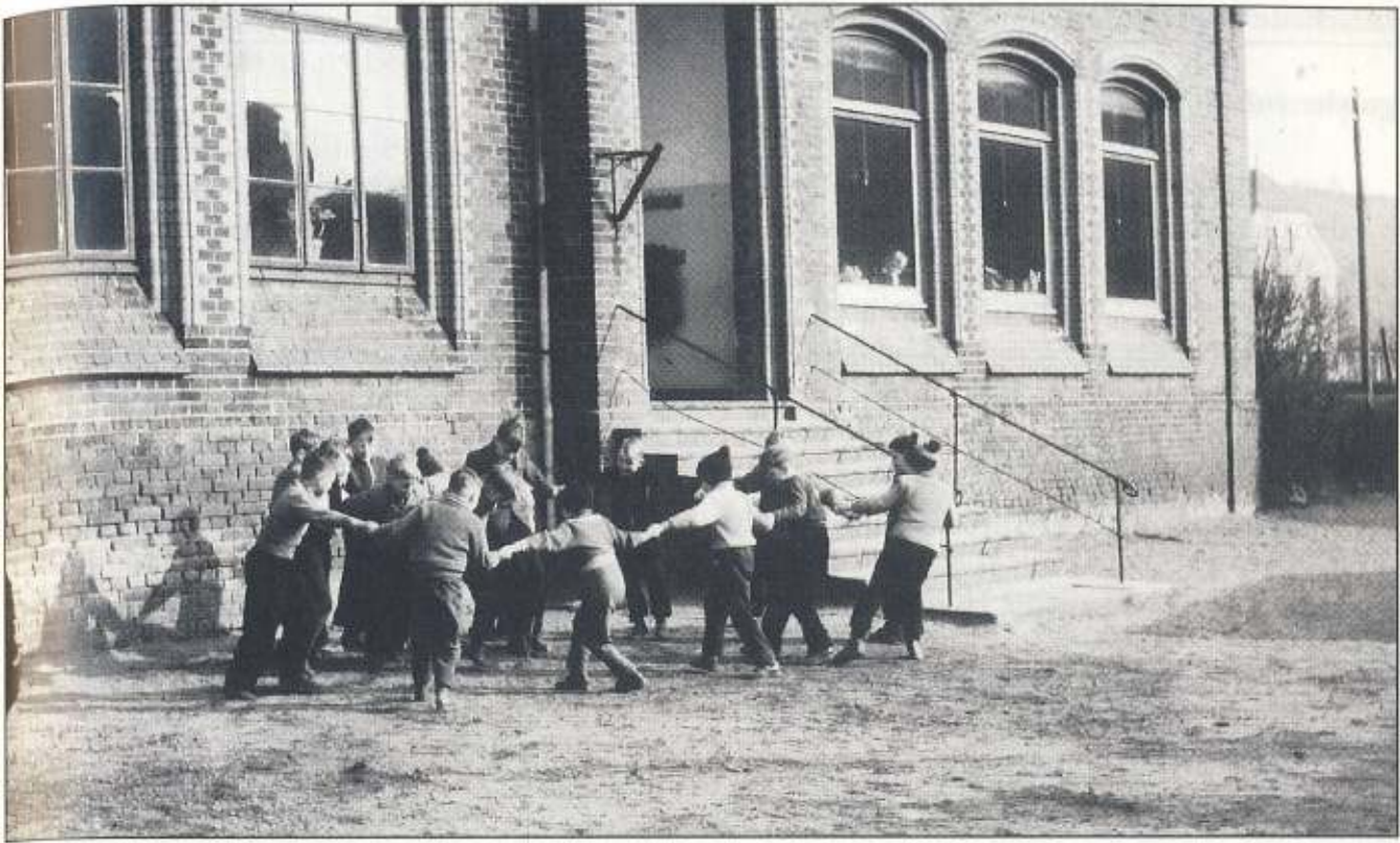
Nr. 113, früheres Schul- und Küsterhaus, ca. 1960, als es noch Schulfunktion hatte