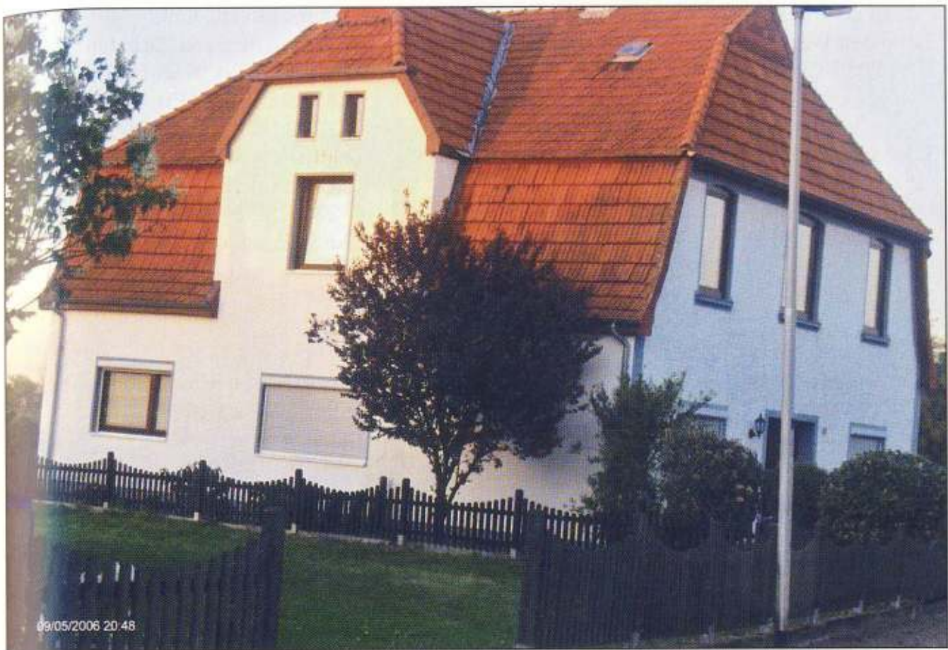
Hofstelle Nr. 106, Rumbarg Nr. 17