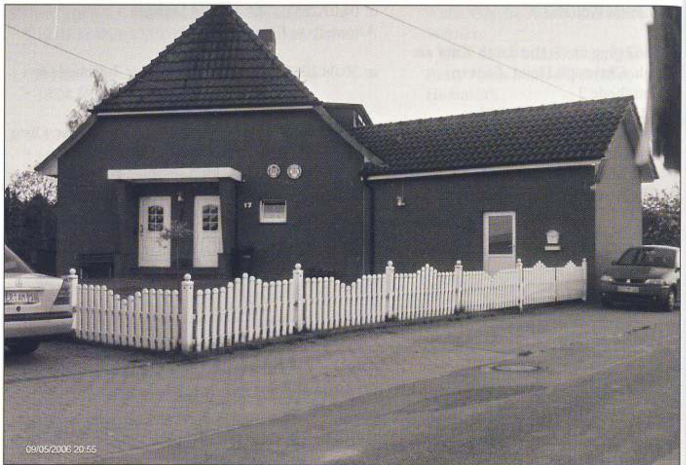
Wohnhaus Nr. 105, Bergende Nr. 17