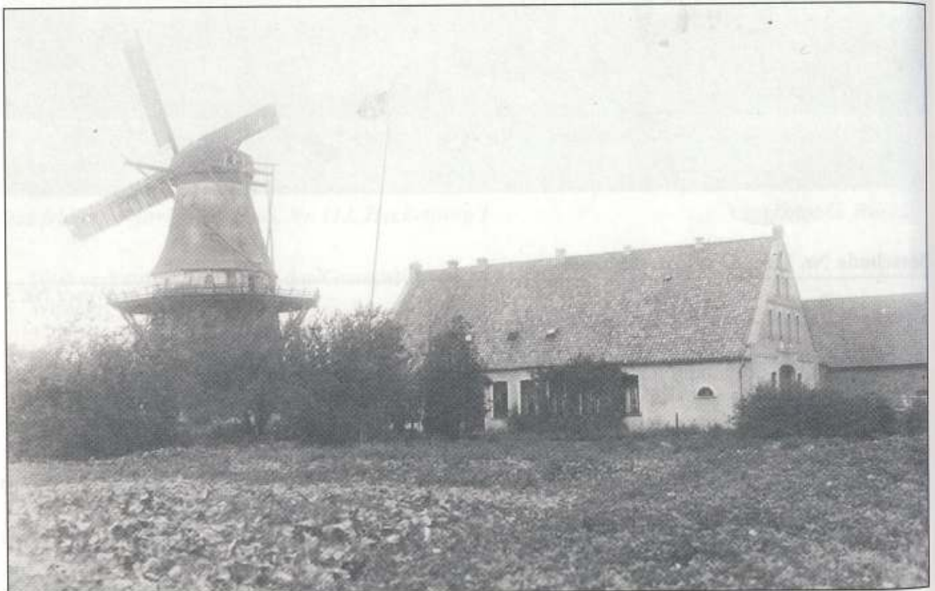
Mühle und Müllerhaus, Nr. 116, auf alter Fotopostkarte