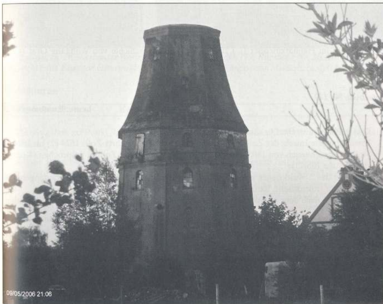
Ruine der Mühle, rechts ein Stück Giebel des Wohnhauses, Nr. 116, Hafenstr. 9