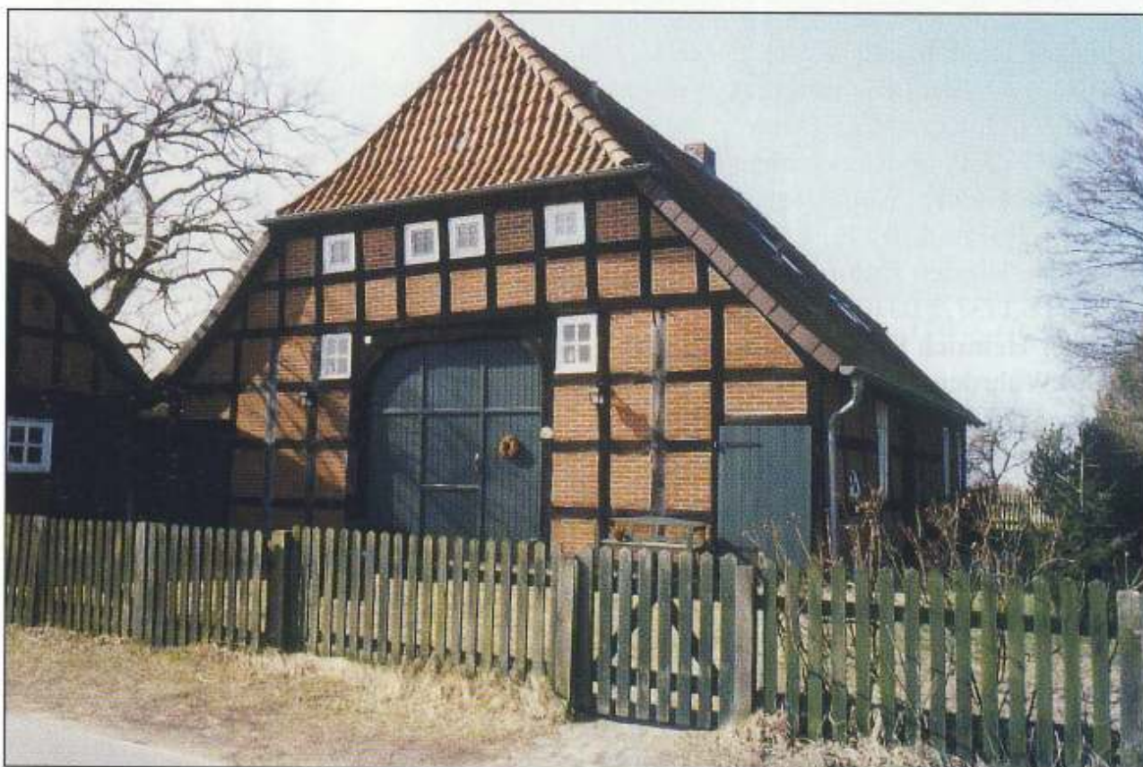
Hofstelle Nr. 53, Zur Weser 7