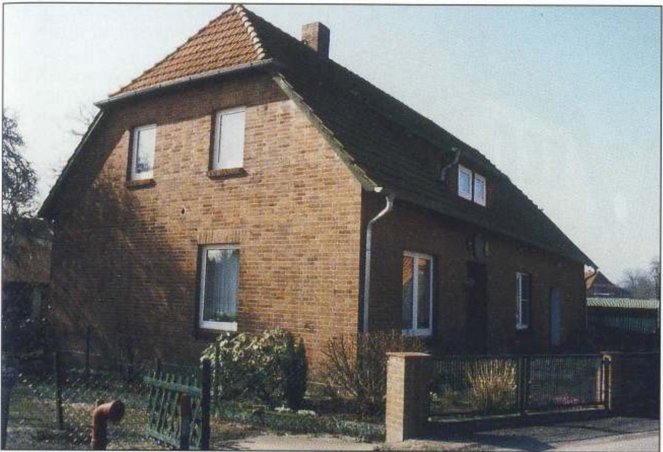
Hofstelle Nr. 50, Bergende 9