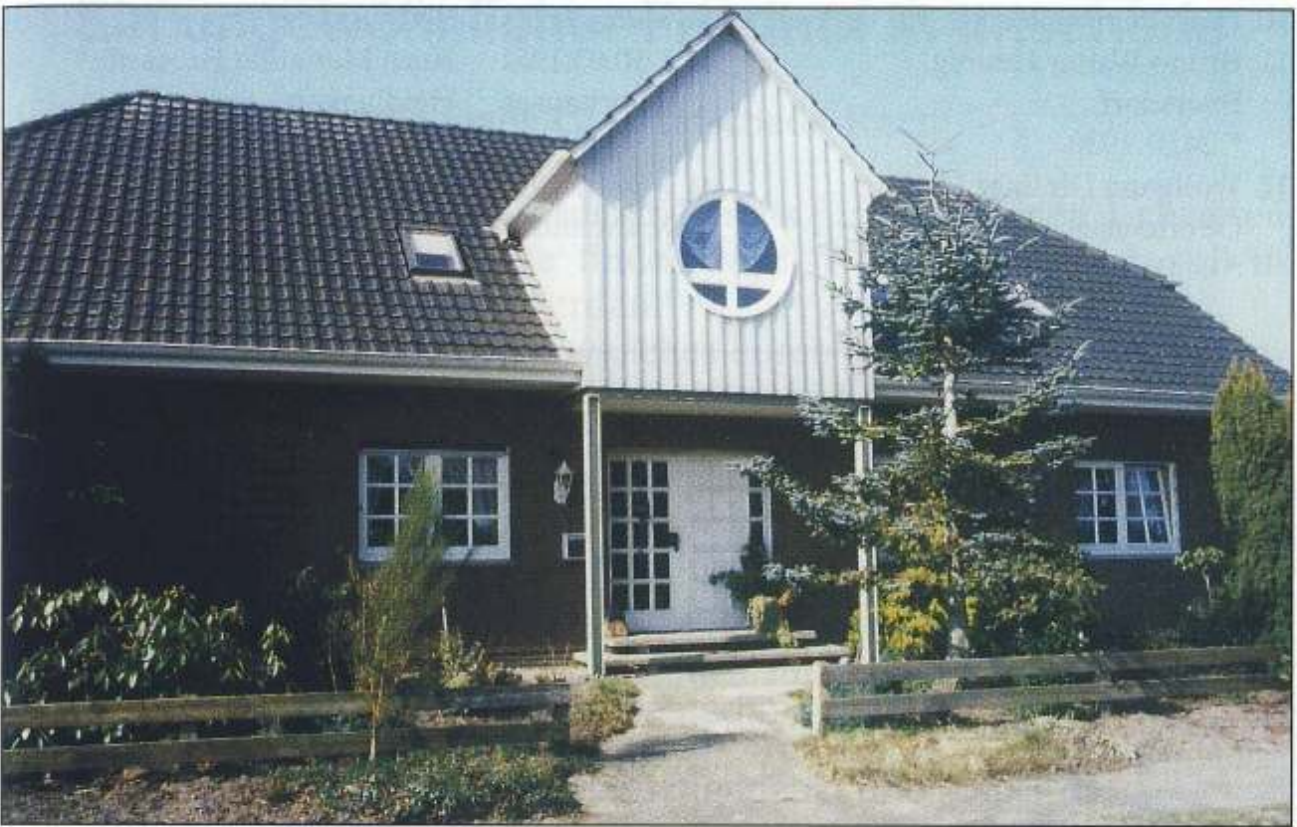
Haus auf der ehemal. Stelle Nr. 60, Intscheder Dorfstr. 41