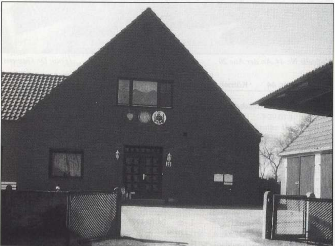
Hofstelle Nr. 45, An der Aue 26