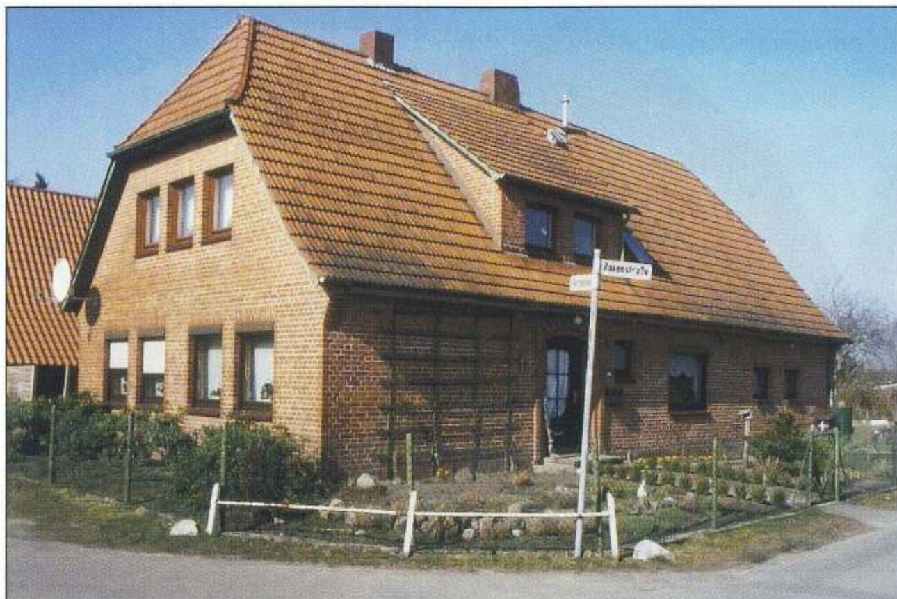
Hofstelle Nr. 51, Hakenstr. 1