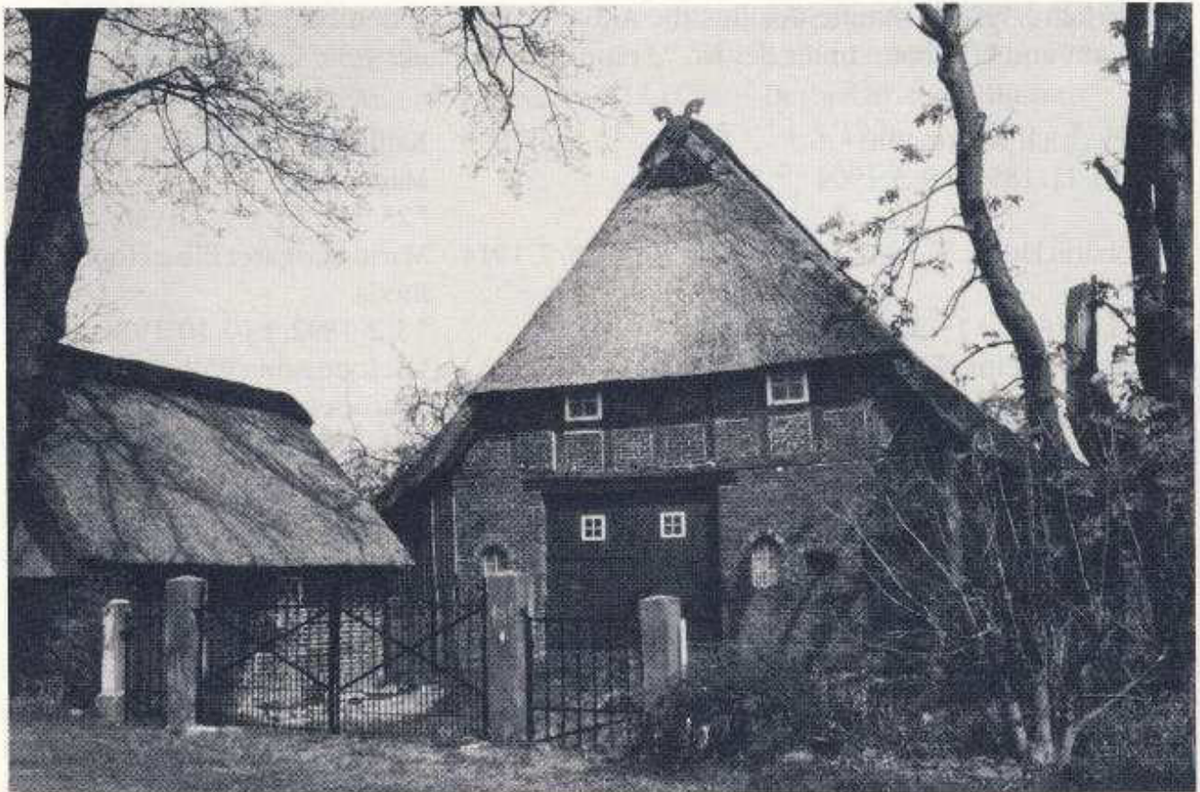
Gebäude der Anbauerstelle Nr. 62.