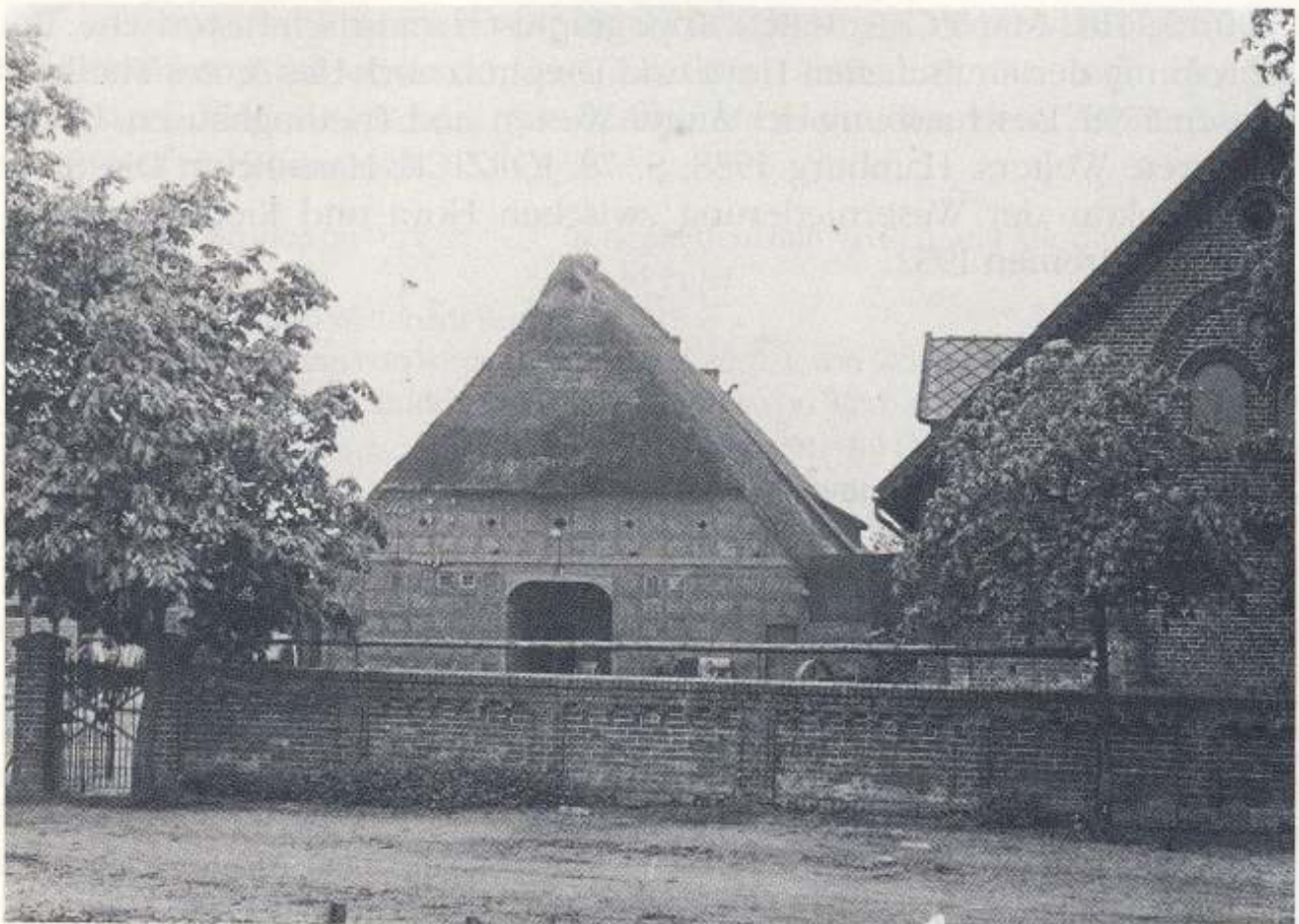
Haus Nr. 42 um 1920